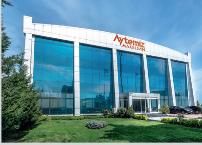
İstanbul Genel Merkez & UPS Fabrika

Türkiye'nin ihracat gücünü daha da artırmayı hedefliyoruz. 300'ü aşkın çalışanımız, 8000'e yakın satış noktası, 30'u askın yurtiçi çözüm ortaklarımız, 80'den fazla ülkede satış ve servis ağıımız ile dünyanın dört bir yanında "tüm kritik uygulamalar için güç kalitesini garanti eden kesintisiz enerji çözümleri sağlamak" taahhüdüyle, bölgede en güçlü KGK üreticisi olma hedefiyle çalışmalarımızı aralıksız sürdürerek ülkemiz için değer yaratmaya devam edeceğiz.